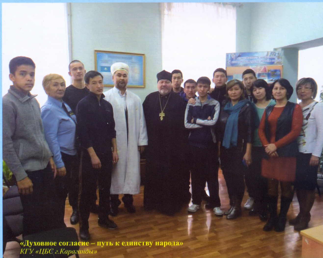
«Духовное согласие – путь к единству народа» КГУ «ЦБС г.Караганды»