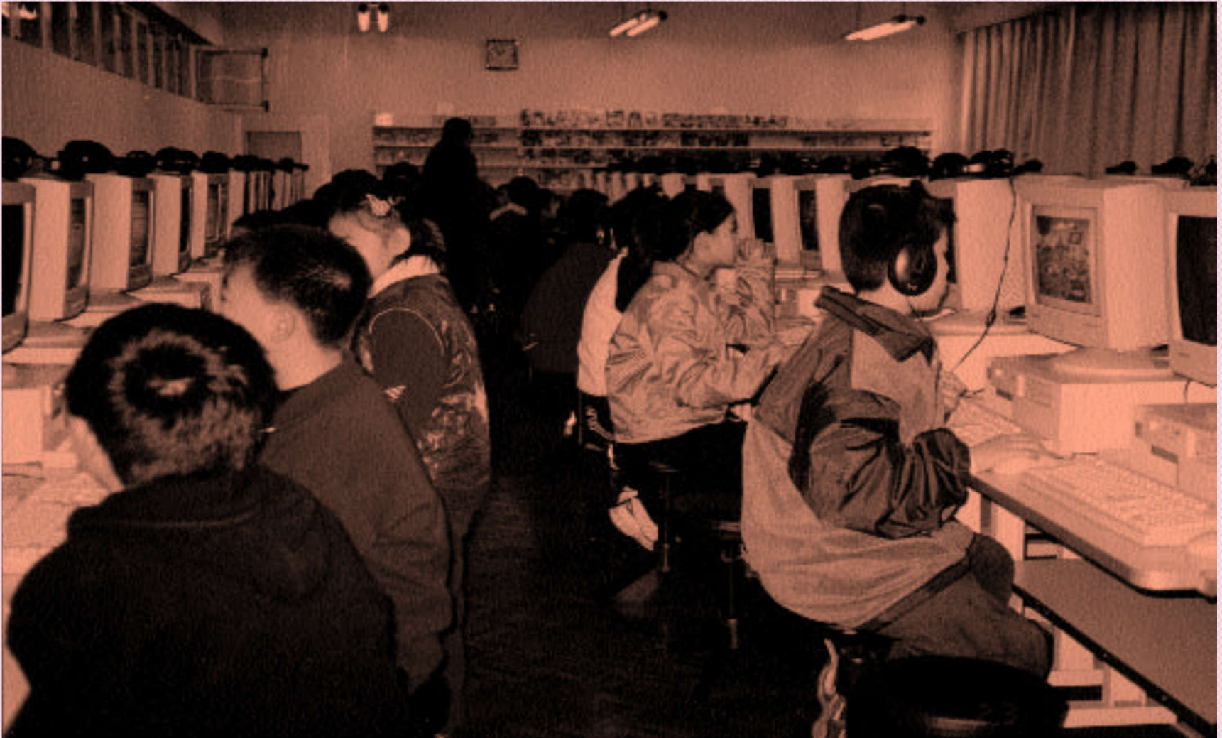
№2 Бейжің мектебі кітапханасының электрондық залы