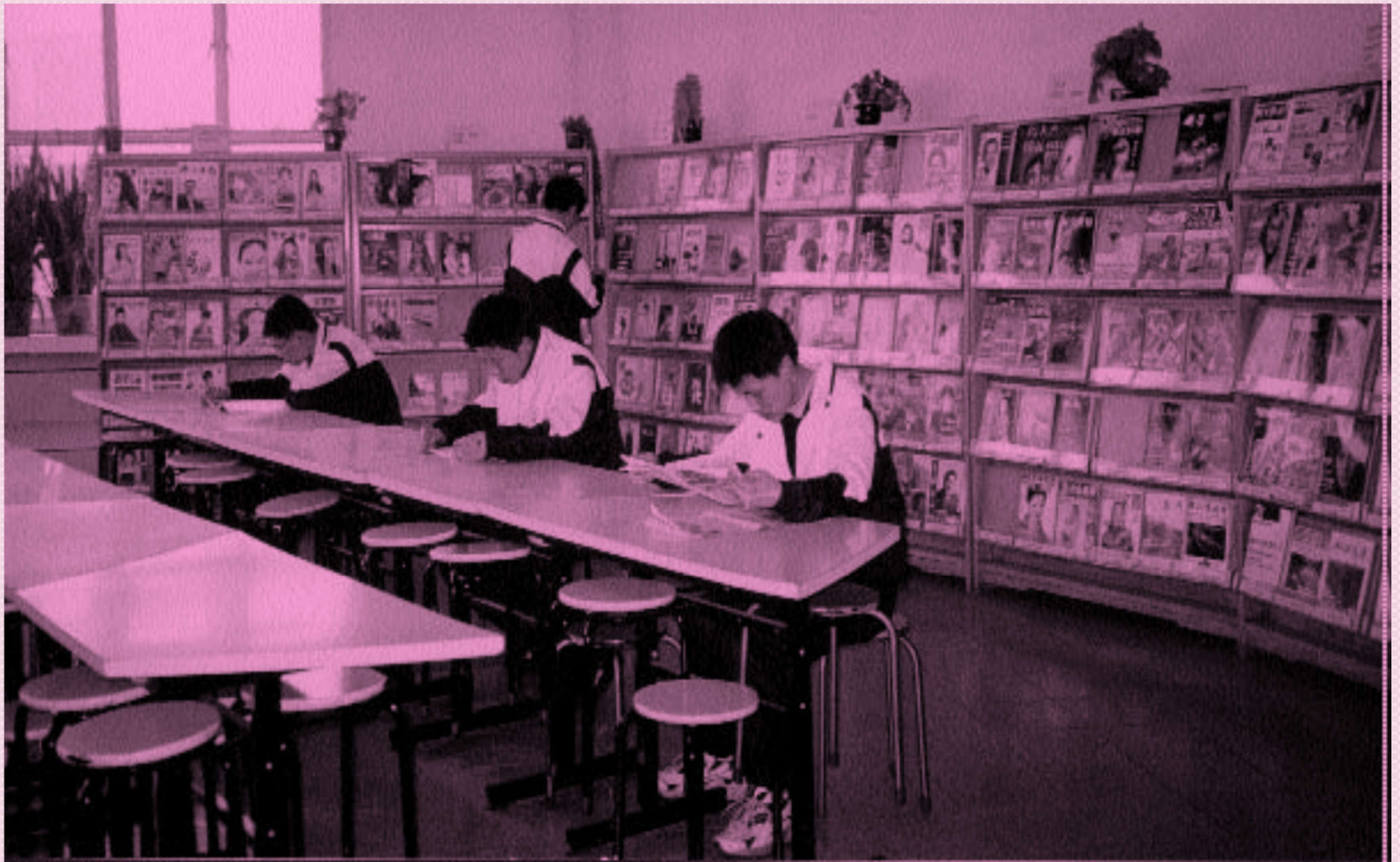
№4 Бейжің орта мектебі кітапханасының оқу залы