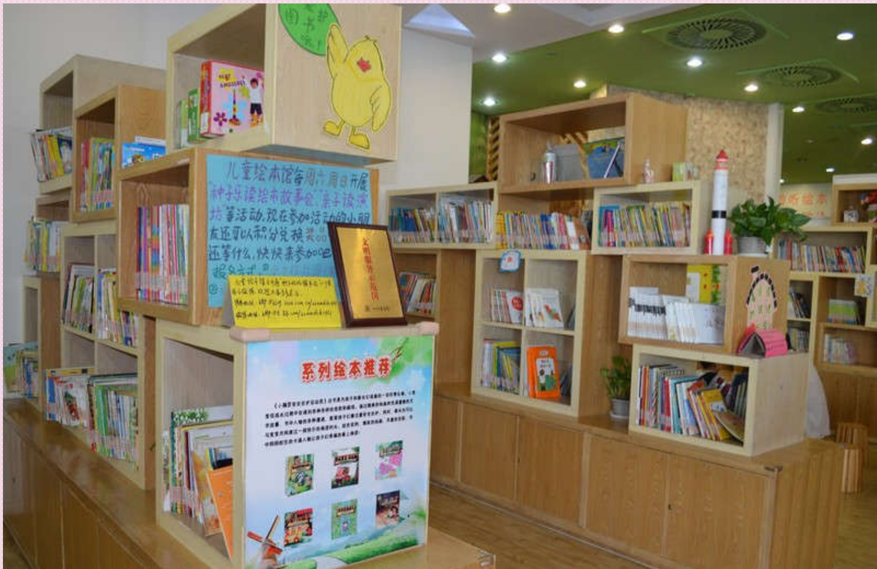
Балалардың кітап сөрелері